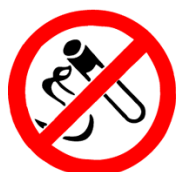
verboden te roken