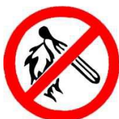
verboden voor open vuur