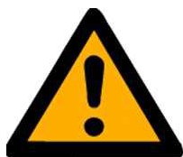
let op gevaar (bij gaskraan)