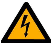
let op elektrische spanning