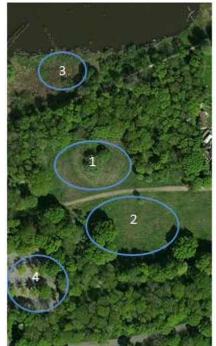
Het scoutingterrein (Digital Globe)

Op het bebouwd terrein stippelen wij een locatie uit voor ons scoutinggebouw, met vijf groepsruimten voor acht speltakken en een logiesfunctie. Daarbij komen bijgebouwen zoals: botenloodsen, blokhut, kampvuurkuil, buitenopslag voor pioniermateriaal, drie vlaggenmasten en een fietsenstalling. Het scoutinggebouw zal ruimte bieden aan scoutingactiviteiten met overnachtingsmogelijkheid. De inrichting zal voldoen aan de gestelde eisen op dit gebied, inclusief de gebruikseisen voor mindervalide scouts. Voor de jongste speltak organiseren wij kampen in ons gebouw, naar de normen van Scouting Nederland. Het gebouw willen wij ook aanbieden voor medegebruik van vaste huurders. De verhuur van het gebouw stellen wij open voor vakanties met minder validen.