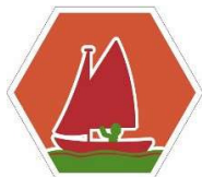
Scoutsinsigne Kielboot I